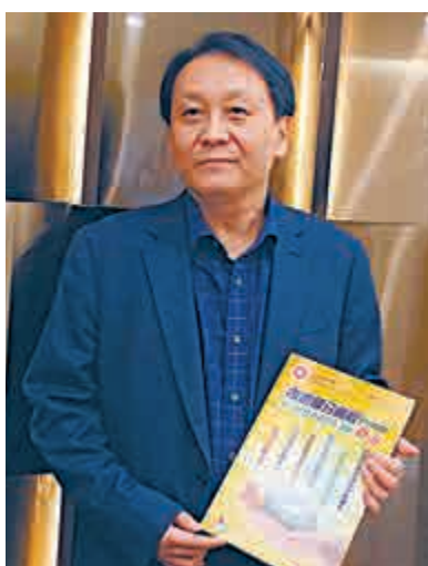
中山大學等廣東地區的大學極受港生歡迎

資料顯示，「免試計劃」推展至今已逾3600人獲錄取，去年錄取約1500名港生。內地院校一般學費約每年4000元至6000元人民幣，藝術類專業則在7000元至12000元之間。教育局並推出「內地大學升學資助計劃」，新學年起資助通過「免試招生」到內地升學而有經濟困難的港生，金額分為半額7500元或全額15000元。